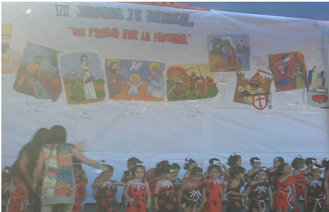
Un centro escolar, el proceso educativo, la acción formativa sobre los niños, vital en el ser humano. Para educar a un niño hace falta “la tribu entera”.

Las personas siempre convivimos en sociedad. No es posible concebir al ser humano tal y como es sin el resto de sus semejantes, sin las aportaciones que estos le realizan. Nos comunicamos y desarrollamos nuestros proyectos vitales junto a otros seres humanos.