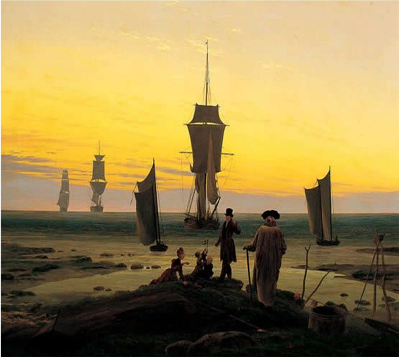
Caspar David Friedrich. 1835. Óleo sobre lienzo. 72 x 94. Museo Der bildenden Künste, Leipzig, Alemania.

Las edades de la vida, lebensstufen en alemán, es una de las obras más conocidas de Caspar David Friedrich (1774 – 1840), y también una de las más estudiadas, profundas y complejas del máximo exponente de la pintura alemana del romanticismo.