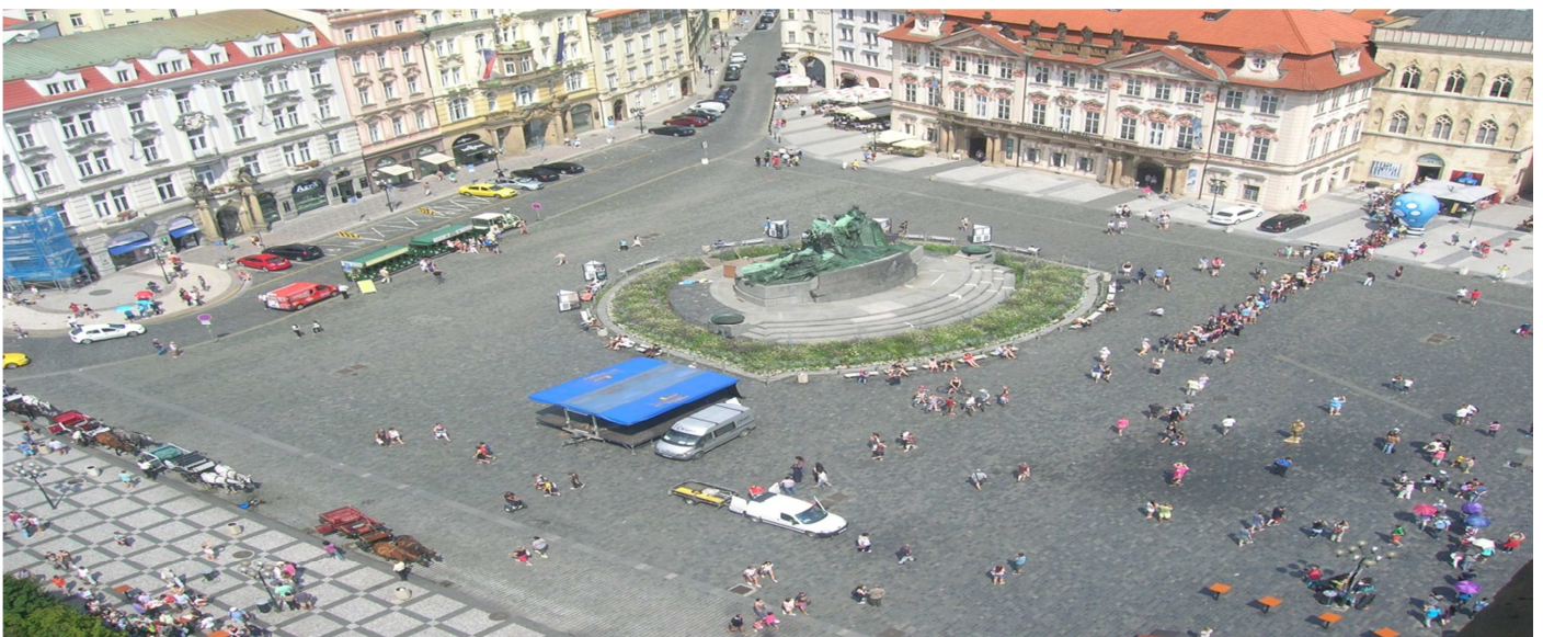
Praga, República Checa. Plaza de la Ciudad Vieja, desde la Torre del Ayuntamiento. Una mirada desde arriba al ser humano, como si tuviéramos en el portaobjetos (cristal) de un microscopio.

Trata de explicar con tus palabras lo que significa que <la persona es un fin en sí misma> . Pon algún ejemplo que sirva de ilustración.