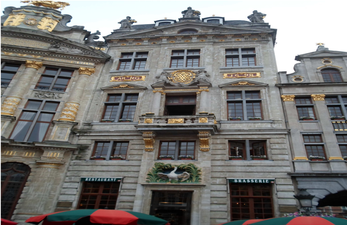
Grand Place, Bruselas, Bélgica. Casa número 9, El Cisne. En esta casa se fundó en 1885 el Partido Comunista Belga.

Se aspiraba a crear un orden social y un sistema de gobierno justos , que garantice la igualdad de todos los ciudadanos.