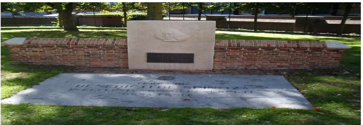
La Haya, Holanda. Nieuwe Kerk. Lugar de enterramiento de Baruch de Spinoza, filósofo racionalista del siglo XVII, defensor de las libertades humanas, y víctima de persecución y expulsión de la comunidad judía a la que pertenecía.

Los derechos fundamentales defendidos fueron el derecho a la vida, a la intimidad, a la libertad de conciencia y expresión, la libertad de pensamiento y expresión, el derecho a la no discriminación, el derecho al voto, protección frente a leyes abusivas, etc.