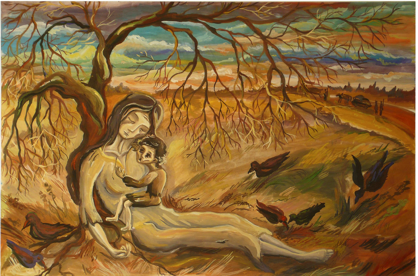
Pintura dedicada al terrible genocidio de Holodomor a través de los ojos de un niño

El Holodomor es un caso flagrante de actitud desarrollada por un estado totalitario contra toda una población, una actitud virulenta contra los derechos humanos del pueblo ucraniano en el período de entreguerras. Un fin político y económico provoca un genocidio.