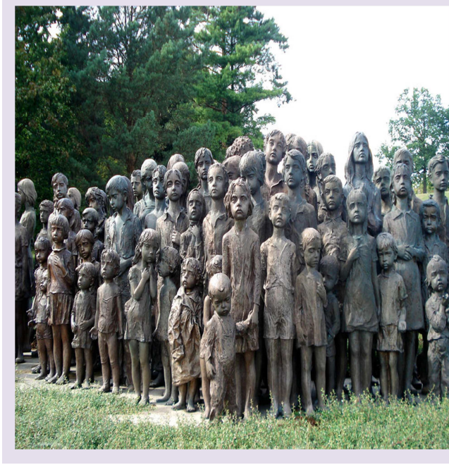
Memorial de los niños de Lidice, en la República Checa.