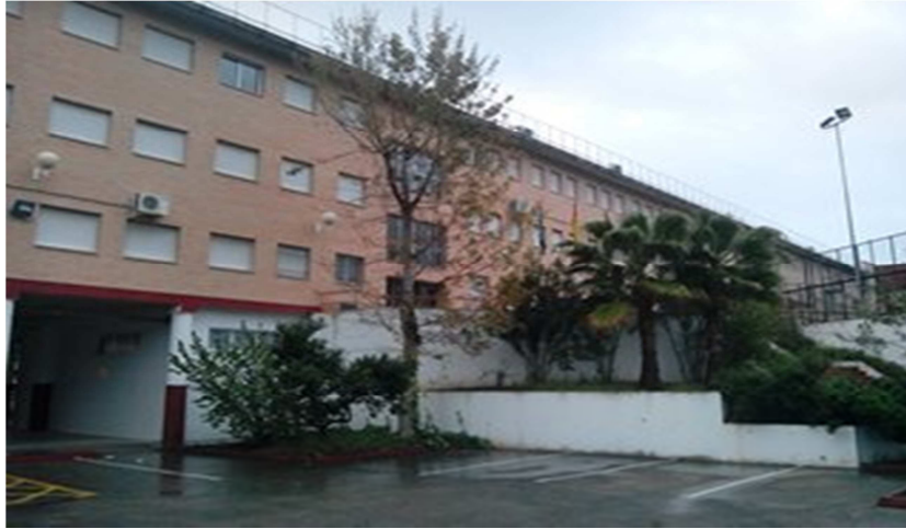
IES Cárbula, Almodóvar del Río, Córdoba. Ejemplo de centro educativo en el que recibimos una formación cultura (una instrucción educativa) imprescindible para poder ejercer como personas.

Por todo ello, el ser humano recibe una educación, una inculturación, es decir, se integra en una cultura.