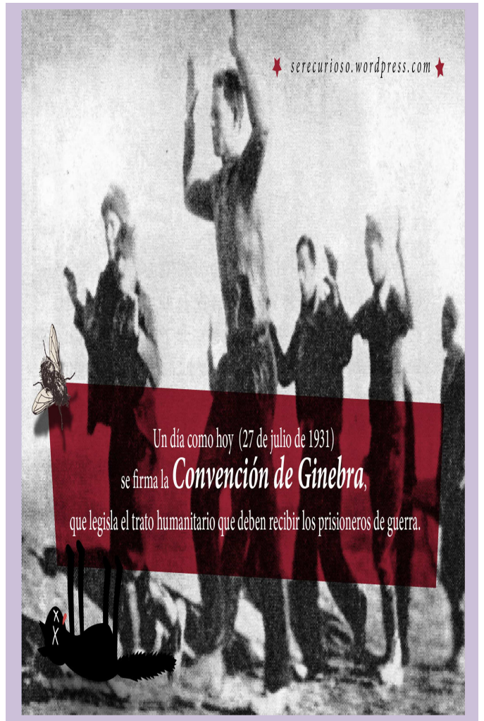
La Haya, Holanda. Tribunal Penal Internacional. Organismo actual de gran relevancia. La Convención de Ginebra, que regula el trato humanitario que debe recibir los prisioneros de guerra.