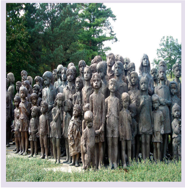
Memorial de los niños de Lidice, en la República Checa.