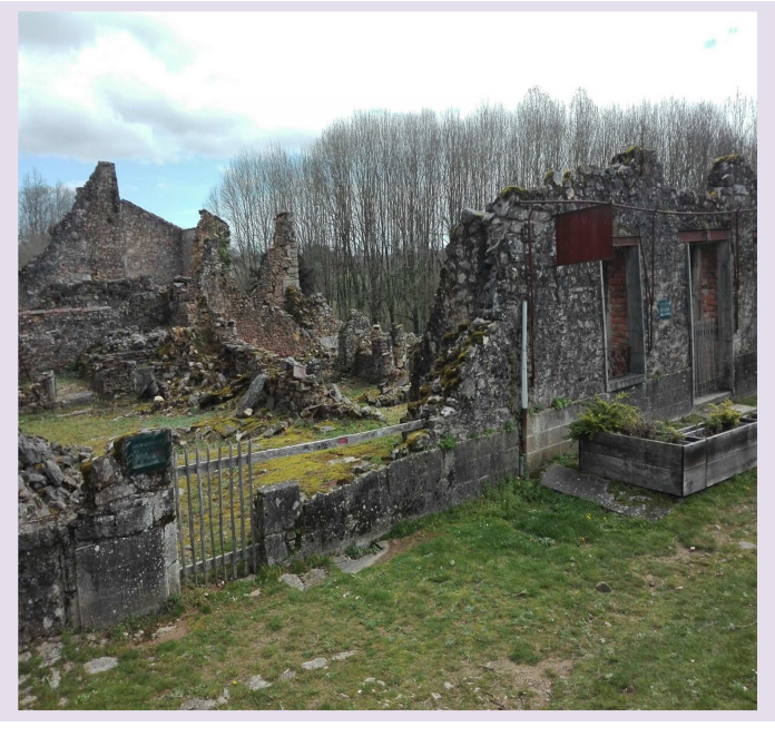
Oradour-sur-Glane. Francia. Restos de la localidad aniquilada.