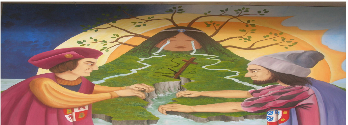
Mural de arte urbano. “ El reparto ”. Tordesillas. Las monarquías de España y Portugal, los Reyes Católicos y Juan II de Portugal, en el año 1494, pugnan por las tierras conquistadas en América. Mientras tanto, la tierra llora, las personas sufren, la naturaleza queda destrozada. La necesidad del entendimiento.

La democracia es una forma de entender la vida y de vivirla conforme a los valores propuestos.