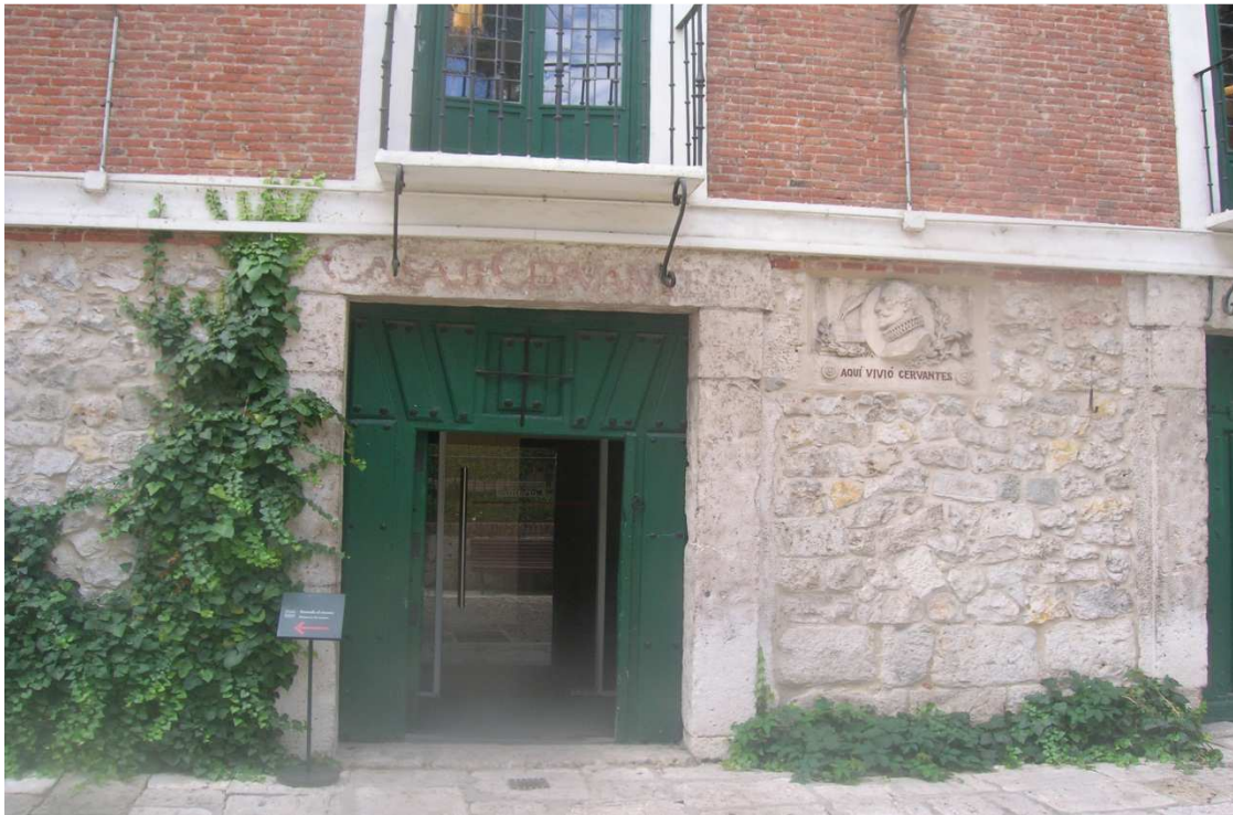
Casa de Miguel de Cervantes, autor del Quijote, en Valladolid.