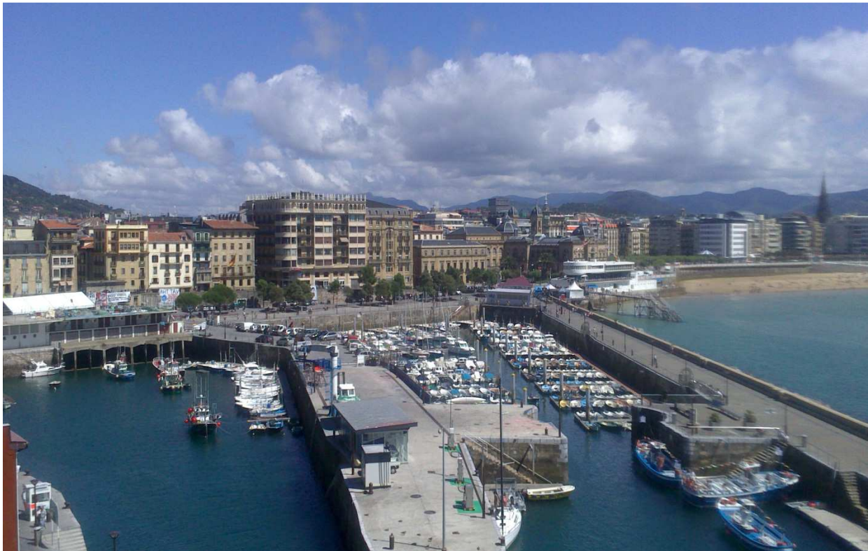
Ciudad de San Sebastián, País Vasco. Al fondo, consistorio. El poder municipal.

La Constitución dice que todos los poderes del Estado emanan del pueblo español. También establece los límites de la actuación del estado, que no son otros que el respeto de la libertad de los ciudadanos. Hay tres grandes mecanismos para alcanzar estos objetivos: