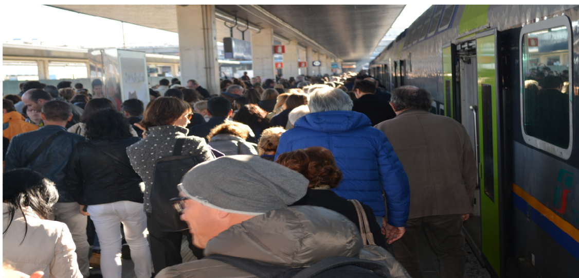
Importancia de los servicios de transportes públicos. Estación de trenes principal de Venecia, Santa Lucía.

Los poderes públicos necesitan recursos económicos para poder crear, gestionar y proteger los bienes públicos (montes, estaciones, aeropuertos, escuelas, hospitales). A través de los impuestos que pagamos los ciudadanos se logran estos recursos. Estos impuestos pueden ser: