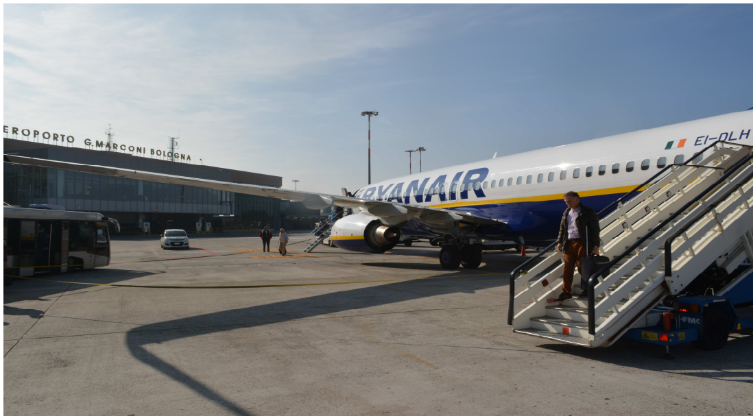
Los servicios públicos esenciales. Aeropuerto de G. Marconi de Bolonia.